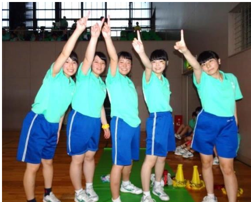
女子バスケットボールで優勝した3年5組