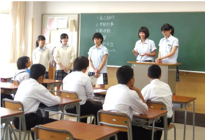
角高生による説明

毎年公開している角田高校オープンキャンパスが7月16日(土)に開催されました。来校者は中学生約300名、保護者約50名でした。体育館で行われた全体説明会の後に角田高校3年生による説明会と座談会を行い、身近な先輩たちの生の声を聞く機会を設けました。また、保護者向けにも教室を開放して説明会を行い、質問も受け付けました。アンケートにも「先輩方が笑顔でやさしくアドバイスをしてくださったのでとてもためになった」と座談会については中学生にも好評でした。