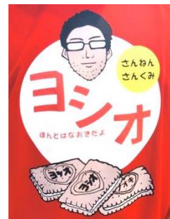
クラスTシャツ賞 3年3組