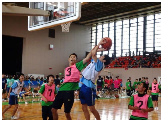
激しくぶつかり合う男子バスケットボール

7月6日(水)・7日(木)の2日間にわたってクラス対抗の球技大会が角田市総合体育館を会場に行われました。初日は男女バスケットボールと男女混合ドッジボールを行い、2日目は男女バレーボールと男女混合綱引きを行いました。クラスごとにTシャツをそろえて2日間熱く戦い応援しました。結果は3年生が貫禄で上位を独占して閉幕しました。