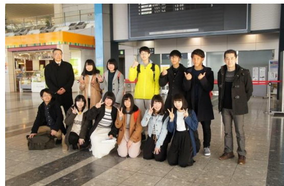
アメリカ短期研修に出発する一行

今回で10回目を数えるアメリカ短期研修が3月16日（木）から12日間の日程で実施されます。今回短期研修に向かうのは角田高校生10名と引率教員2名の12名です。一行は本校の姉妹校であるアメリカ合衆国デラウェア州ドーバー高校との交流とホームステイを軸に、異文化を体験しながら見識を広げてくる予定です。