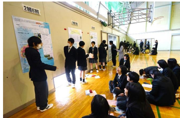
ポスター発表をする生徒