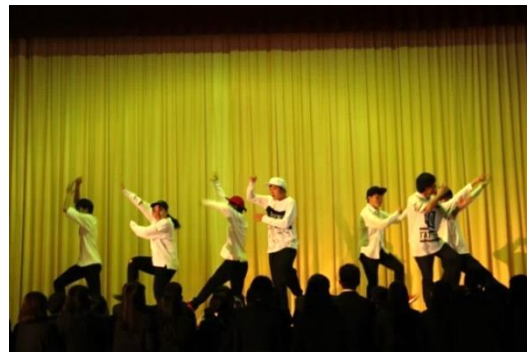
有志によるダンス

卒業式を間近にひかえた2月27日（月）に予餞会が開かれました。吹奏楽部の演奏や有志によるダンス、部活の後輩からの先輩へのビデオメッセージ、転任した先生からの卒業生への手紙が読み上げられました。最後に全校生徒で凱歌を歌って終わりました。