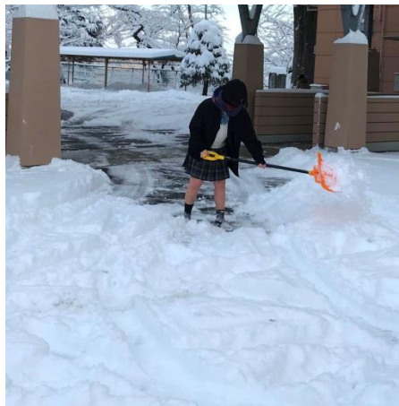
＜女子生徒も手伝ってくれました＞