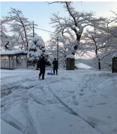
＜野球部員による雪かき＞